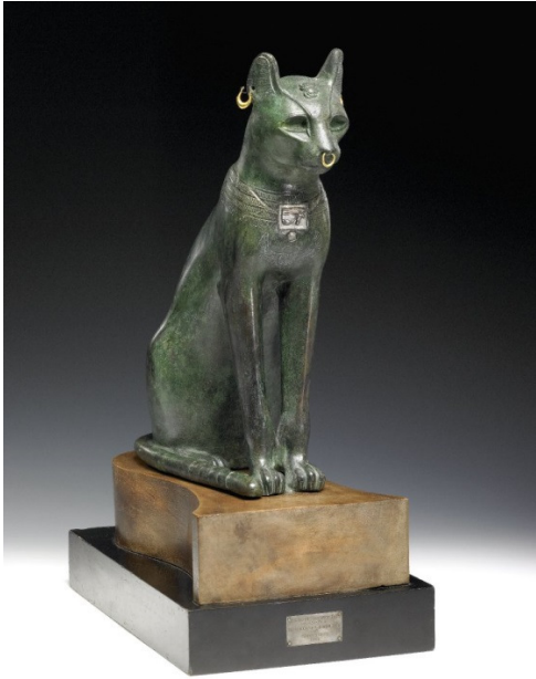
2. kép Gayer-Anderson macska