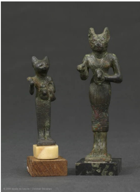
3. kép Bastet emberi alakban, állatfejjel