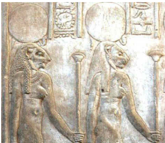
1. kép Basztet és Szahmet