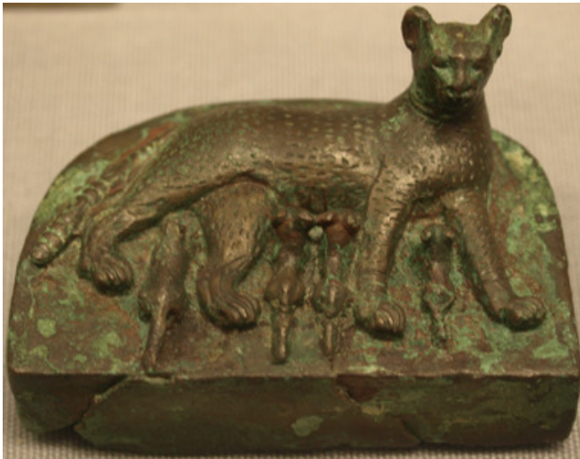
5. kép Bastet macskakölykökkel