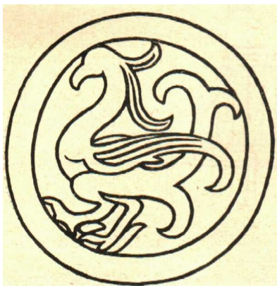
1. ábra. Fedélszerép zárólappja főnixábrázolással. Kína. Han-korszak. Laufer után.

Abschlussplatte eines Dachziegels mit Phönixdarstellung. China. Hanzeit. Nach Laufer.