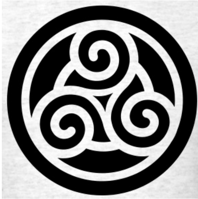
9. kép Kelta triskelion