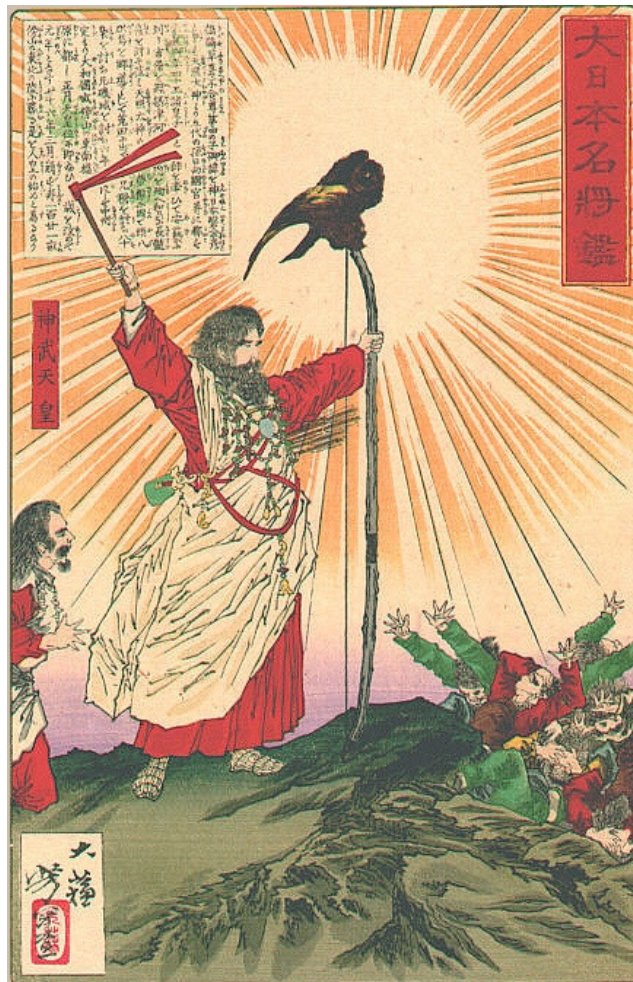
4. kép Jimmu császár Yamato felé

A történelemben is sok helyen megjelenik, mint például a Kojiki és a Nihonshoki krónikái szerint a mennyek küldték a nagy varjút, hogy kísérje útján Jimmu császárt, Japán legendás, első császárárt. Ezt a japánok isteni beavatkozásként értelmezték. 8