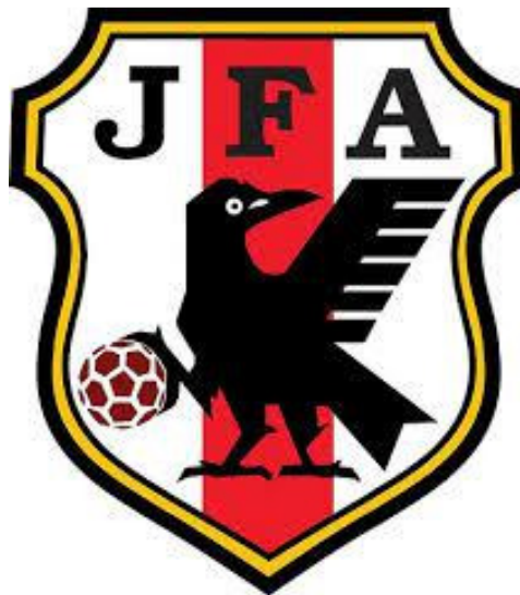
11. kép Japán Futball Szövetség emblémája

A háromlábú varjú a mai napig megőrizte a jelentőségét, és megjelenik több helyen. Japánban a Futball Szövetség jelképe, Dél-Koreában is több cég emblémájában szerepel. Amikor a 21. század elején szóba került az ország pecsétjének a leváltása, akkor az egyik javaslat maga a samjoko , a háromlábú madár volt. Valamint a populáris kultúrában is megtalálható, a híres Jumong dél-koreai televíziós sorozatban is, amely Goguryeo alapítójáról szól, gyakran előkerül ez a szimbólum.