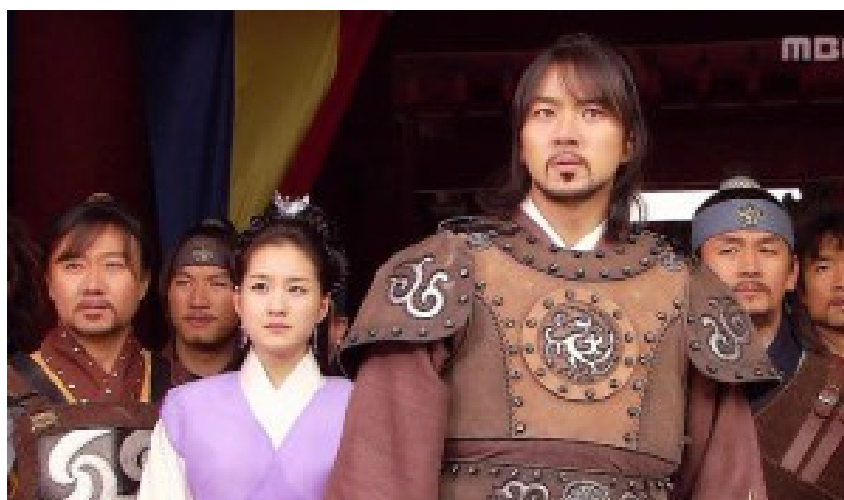
12. kép Jumong televíziós sorozat