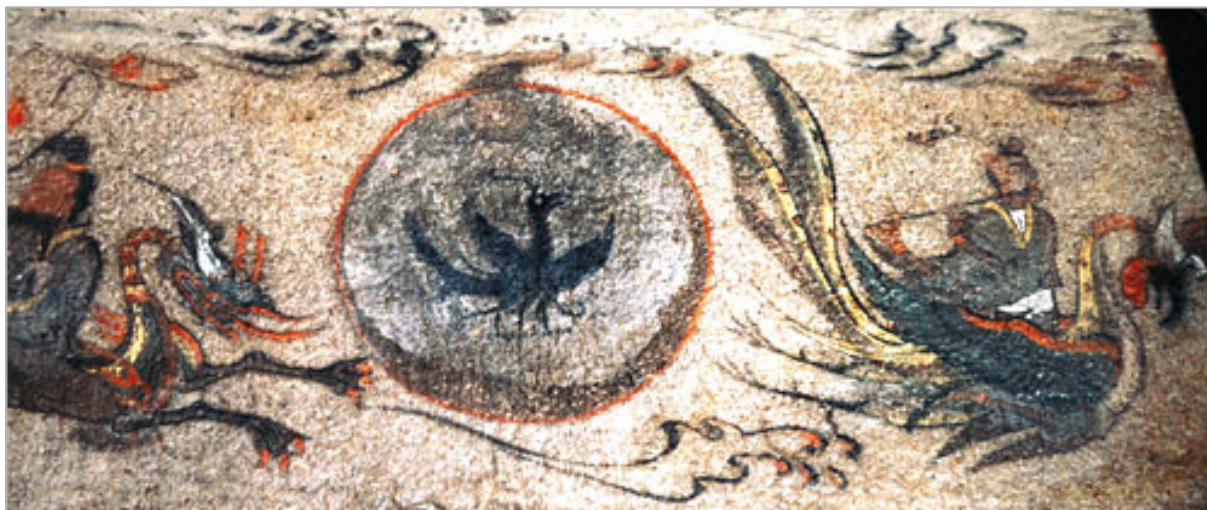
3. kép Sír festmény Goguryeo korából

A másik, Yeonorang és Seonyeo (연오랑 세오녀) története. 157-ben, Adala király uralkodása idején élt egy házaspár egy halászfaluban. Egy nap algagyűjtés közben Yeonorang a tengerparton egy olyan sziklát látott, amit azelőtt még soha. Felmászott rá, mire a szikla mozogni kezdett, és belegurult a vízbe. Yeonorang nem tudott mit tenni, ott maradt a sziklán, ami egészen Japán szigetéig úszott. A japánok azt hitték, hogy az Isten küldte a férfit, így királlyá koronázták. A felesége Seonyeo várta otthon, de ő nem jött. Minden nap kiment a tengerpartra, hátha visszatér a férje, míg nem egy nap megjelent a szikla, rajta a férje cipőjével. A nőt is Japánba vitte a szikla, és ott királynő lett. De mikor elhagyták mindketten Sillát, akkor ott a nap és a hold megszűnt világítani. Adala király követet küldött Japánba, hogy térjenek vissza, de mivel ott már király és királynők voltak, ezért Yeonorang a felesége egy saját kezűleg készített selyem szövetet küldött vissza Sillába, amivel egy szertartást mutattak be a Mennyei istennek, mire a nap és a hold fénye visszatért. 7