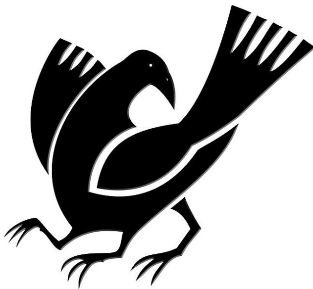
1. kép Háromlábú varjú egy japán emblémán

A lábak hármasszáma utalhat az Ég-Föld-Ember hármásra, ami a keleti kultúrákban jelentős volt, de ugyanakkor jelentheti a nap három állomását, a felkelő, delelő és lenyugvó napot is. 1