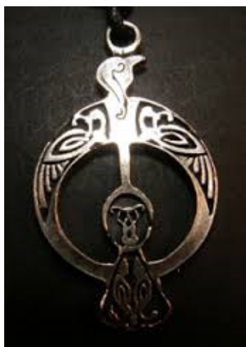
6. kép Kelta hollószimbólum medál

Edgar Allan Poe versében, A holló című műben a gonoszt jelképezi. 11