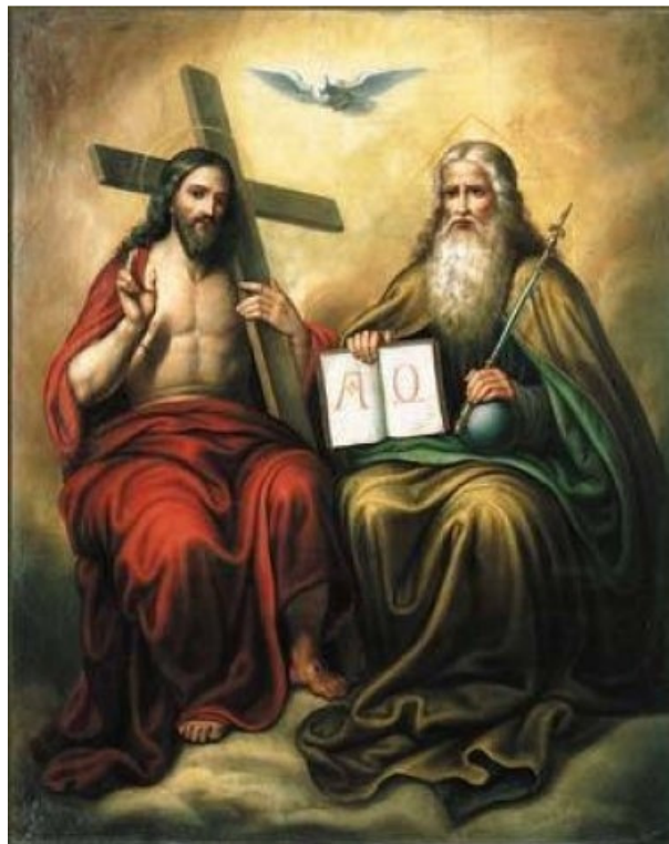
8. kép Szentháromság

A magyar népi hitvilágban is fontos szám a hármasság, a hetes és a kilences mellett. A hármasság szám valamely mágikus folyamat elvégzésekor jelentős. Ilyen a népmesékben a három fiú, vagy a három próbatétel, amit teljesíteni kell. A három napszakhoz köthető szertartások is kapcsolódnak hozzá. Szerencse vagy szerencsétlenség elkerülése miatt sokszor megismételték a tevékenységet háromszor. 12 És a mondás is úgy tartja, hogy három a magyar igazság.