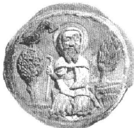
5. kép Szent Benedek és a holló