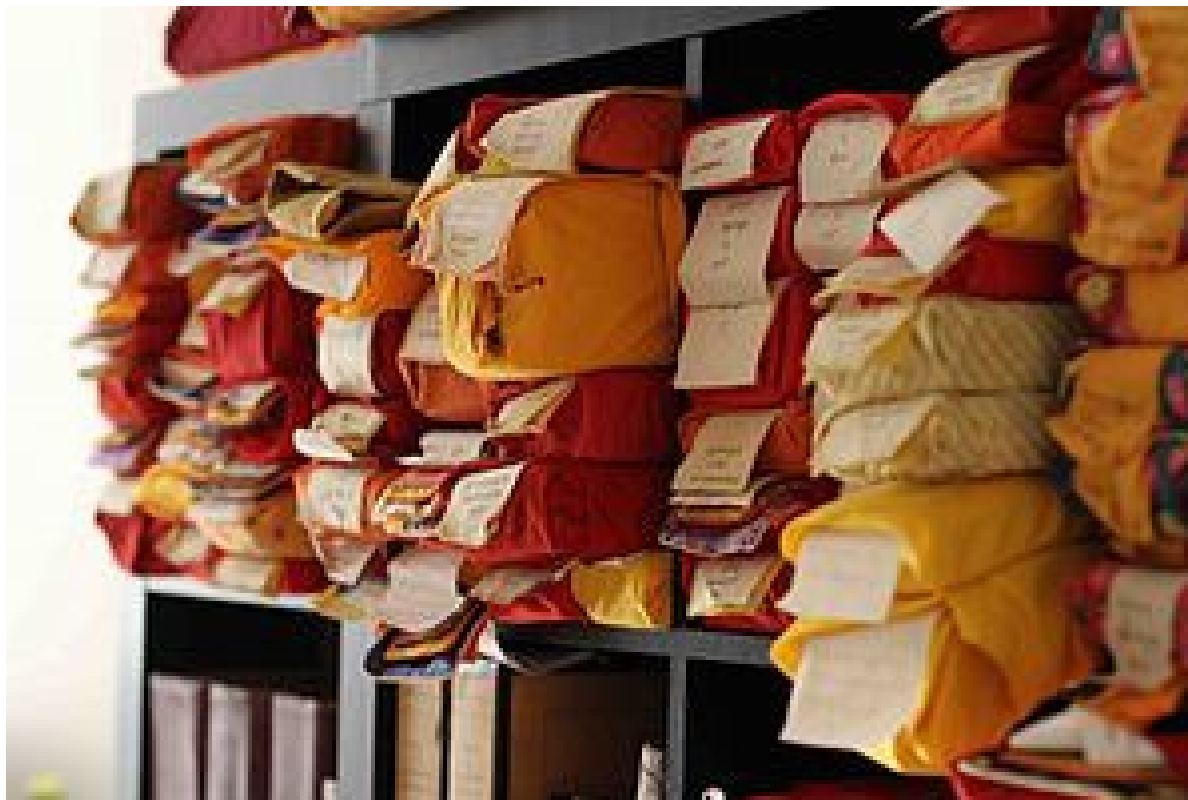
A tibeti kánon egy része