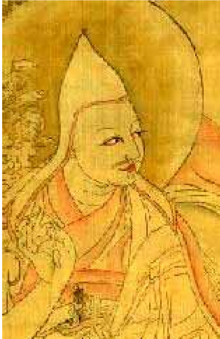
Ngavang Loszang Gyaco