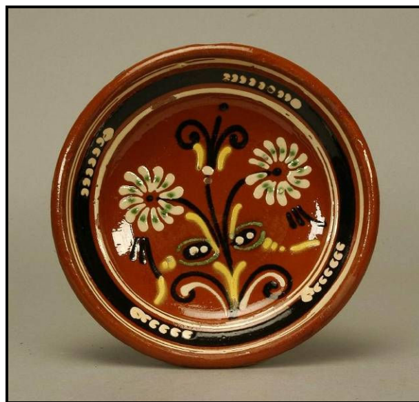
Mórággyi tányér életfa-motívummal

Ezeket a díszes tányérokat nem mindennapi használatra készítették: legfeljebb lakodalom vagy más ünnep alkalmával használták őket. Az év többi napján rendszerint ezek a tányérok a tisztaszoba falát díszítették – a fazekasok eleve akasztófüllel látták el őket. Az sem mellékes, hogy párosával akasztották őket a falra. Ilyen kontextusban az arcszerű összképnek, kiváltképp a hangsúlyos, szemekre hasonlító virágoknak akár védelmező, őrző szerepet is tulajdoníthatunk. Erre más, ennél egyértelműbb példák is akadnak a Kárpát-medence fazekasságában: a körösrévi aratókorsók sajátossága, hogy két mandulaforma szemet festettek rájuk, amelyeknek valószínűleg nemcsak esztétikai, hanem védelmező funkciójuk is volt.