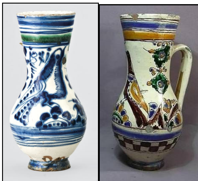
Tordai és nagyszebeni bokály, utóbbin a madár mellett a kettős koronájú életfa

Az erdélyi kerámiák madarai is mindig egy fa ágán ülnek, néha csőrükben is faágat tartanak. Ezeknek az edényeknek – tányéroknak és bokályoknak – a madarai az életfa őrzői. „A lába alá helyezett kerek virág a Napot szimbolizálja, a csőréből kinövő virágos ág pedig azt jelzi, hogy evett az életfa gyümölcséből.” 18 A madár gyakran a kettős koronájú fa társaságában is megjelenik, az is előfordul, hogy a kerek virág két oldalán két madár ül. A 19. század második felétől megjelenik egy olyan kompozíció, amely a két madarat mint szerelmespárt ábrázolja, ám itt sem maradhatnak el az életfára utaló ágak (persze nem lehetünk biztosak benne, hogy ez az utalás mindig tudatos volt).