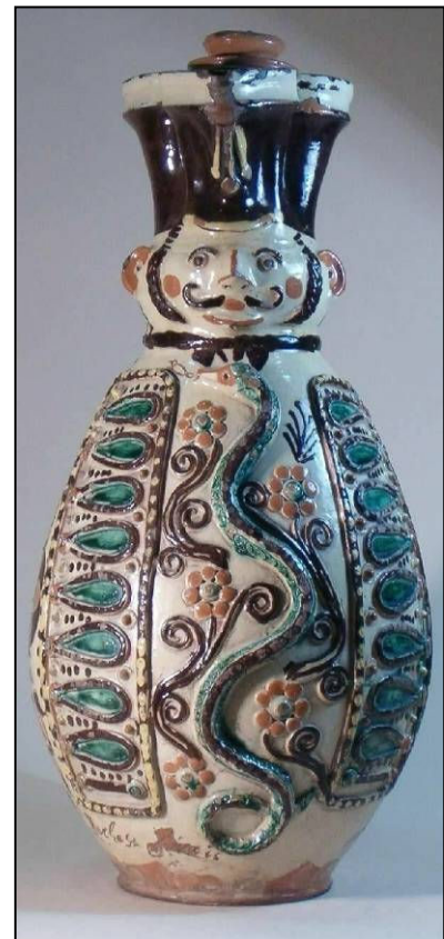
Mezőcsáti miskakancsó, Rajczy Mihály munkája

A miskakancsó bor tárolására szolgáló, emberformájú, gazdagon díszített kancsó, mely 19. század eleji magyar katonát ábrázol, a legkorábbi ismert évszámos miskakancsó 1828-ban készült. Az edény szája és kiöntője a katona süvege, ez alatt az edényre bajszos, hosszú hajú katona arcát festették. Az edény hasán lévő díszítmények a katona öltözetét idézik plasztikus zsinórozással (sujtással) és gombokkal, valamint virágmintákkal. A legtöbb ilyen edény a 19. század 40-es, 50-es éveiben készült, legtöbbször a kígyó motívummal. A miskakancsók kígyója vagy elöl, a két sujtássor között, vagy hátul, a fülön látható. Minden esetben plasztikus díszről van szó, amely – a kancsó egyéb díszével együtt – a fazekas mesterségbeli tudását, hozzáértését is mutatta. A kígyót vagy zöldre, vagy barna színűre festették; a klasszikus miskakancsók alapszíne a fehér, melyre vörös, zöld és barna színnel kerültek a díszítőmotívumok. A legszebb ilyen edényeket Mezőcsáton és Tiszafüreden készítették, de Dél-Alföldön is készültek miskák. A legszebbeket életfa vagy madaras életfa is díszíti.