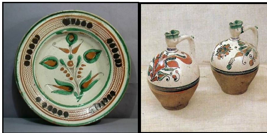
Vámfalui tányér és korsók az életfával

Az életfa motívumát nem csak tányérokra, de a vámfalui mázas korsók vállán is megtalálhatjuk.