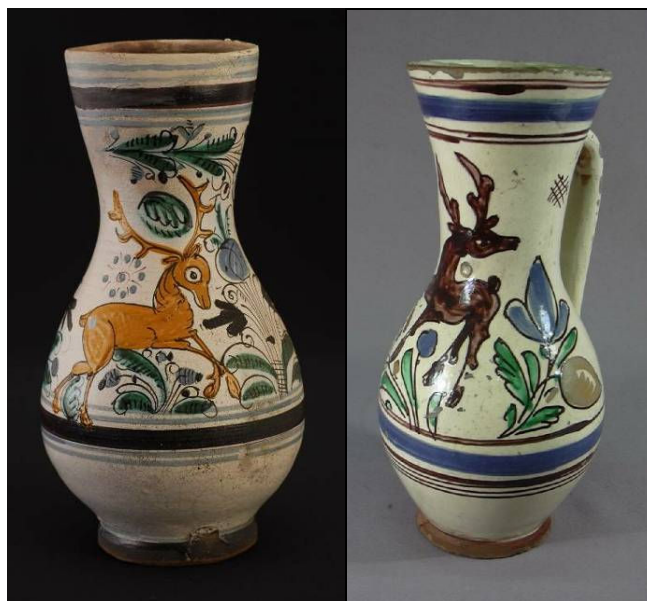
Habán és magyar szarvasmotívum