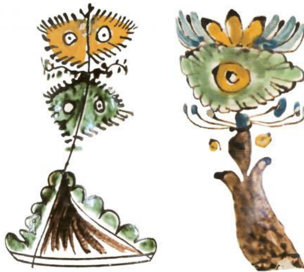
Tordai bokályok életfája

Tordán olyan életfa is készült, melynek csak egy koronája volt, melynek „szemét” sárga színűre festették, így még valószínűbb, hogy napkorong-szimbólumról van szó.