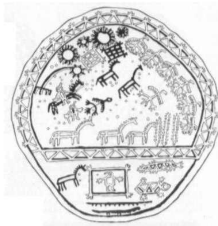
Teleut sámándob rajza

A Kárpát-medence fazekasművészetét egyedülálló változatosság jellemzi: a XVIII. századra kialakult az egyes központokra jellemző sajátos formavilág és díszítésmód. Anélkül, hogy azt állítanánk, hogy a sámánizmusnak vagy az ősi magyar hitvilágnak közvetlen hatása lenne a magyar népi kerámiára, megállapíthatjuk, hogy a magyar fazekasművészet motívumbeli gazdagsága lehetővé teszi, hogy egyes elemeit párhuzamba állítsuk az ázsiai sámánizmusok és népvallások tárgyi világának szimbólumaival. Ez a szemlélet arra is alkalmat ad, hogy egy adott tárgyért mint világmodellt, vagy egy boroskancsót mint az őskultusz kellékét vegyük szemügyre.