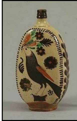
Mezőcsáti madaras butella

A virágos ággal ábrázolt madarakat az alföldi kerámiákon is megtalálhatjuk, elsősorban butellákon és tányérokon. A legszebbek ezek közül is Mezőcsáton, a 19. század közepe táján készültek.