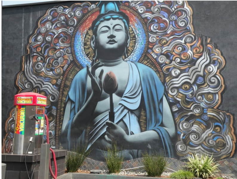
1. ábra: Buddha Los Angelesből