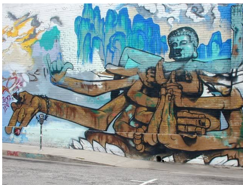
5. ábra: Gaia Buddhája

A következő graffiti egy Gaia álnévű művész rendkívül érdekes és összetett alkotása, sokféle jelképet sűrít egybe 18 .