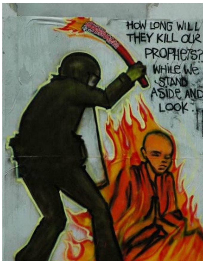
4. ábra: Buddhista szerzetes tiltakozása

A következő graffiti egy Gaia álnévű művész rendkívül érdekes és összetett alkotása, sokféle jelképet sűrít egybe 18 .