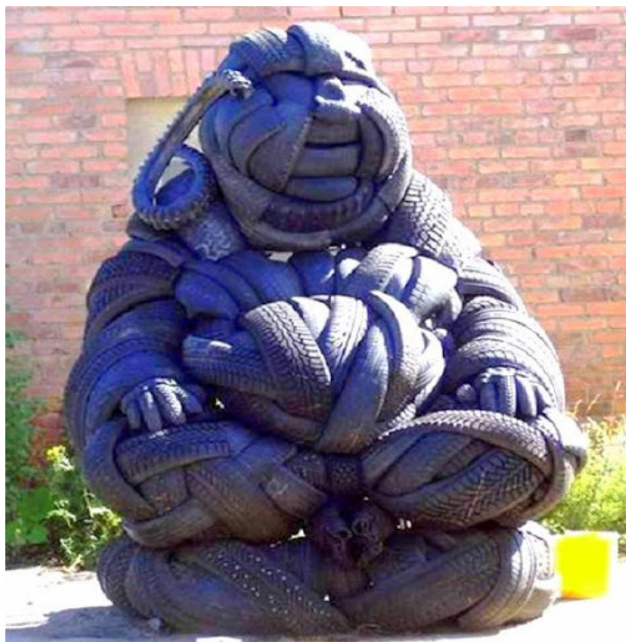
6. ábra: Gumiabroncsból készült nevető Buddha

Utolsó választott képem nem kapcsolódik szorosan a témámhoz, de meglepő radikalitása miatt úgy gondolom, érdemes megemlíteni, ezt a csupa gumiabroncsból 20 készült nevető Buddhát, aki a hagyományos felfogás szerint a következő Buddhát, vagyis Maitreja (szk. Maitreya) bódhiszattvát (szk. bodhisattva) ábrázolja.