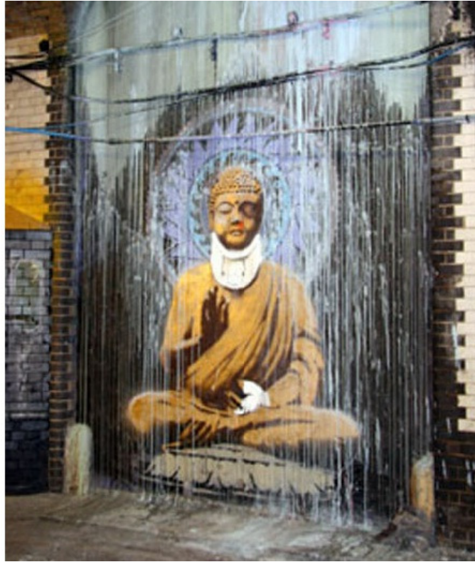
3. ábra: Banksy Buddhája

Ez az alkotás közelebb áll az eredeti Buddha-képekhez, ruházata és színei teljesen megfelelnek annak. A lótusz ülés és a fej jellegzetes vonásai is megvannak, bár a fülcimpa nem túl hosszú, ezt a nyakmerevítő magyarázhatja. Kéztartása (jobb keze) vitarka mudrában (szk. Vitarka mudrā) van, bal keze pedig mintha félig dhjána mudrában (szk. Dhyāna mudrā), vagyis a kizárólag buddháknak fenntartott kéztartásban lenne, mely a meditáció általánosan alkalmazott kéztartása 15 . Bal kézfeje bekötözve, nyakmerevítőben, ez egyértelműen a háborúskodás és fegyveres konfliktusok elleni felszólalást jelképezi. Ez is mutatja, hogy a graffitik nem csak az adott közösség problémáival foglalkoznak, hanem más, régi, nemes kultúrákat, országokat érintően is hangot adnak elégedetlenségüknek, képeiken keresztül. Buddha feje mögött itt már hitelesebb, mandala -szerű aurát látunk, de a színei itt sem helyesek.