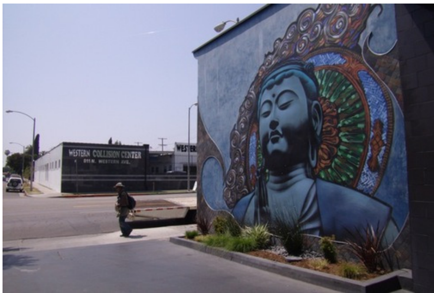
2. ábra: Buddha Los Angelesből a fal másik felén

Ha a két képet nem hozzáértő szemek pillantják meg, szinte tökéletesnek tűnhet az ábrázolás. Azonban ha onnan indulunk ki, hogy ez a két festmény egy automata autómosót határoló két fal díszje, akkor gyanakodni kezdetünk, hogy talán mégsem olyan hiteles munkát látunk. Részletesebben vizsgálva észrevehetjük, hogy ez a Buddha egy kicsit „sántít”, és nem csak azért, mert feltehetőleg lótuszülésben lévő lábait nem ábrázolták, amely hagyományosan a nyugalmat jelképezi 11 , hanem azért, mert látványos, de hamis elemekkel díszítették ki. Sorban